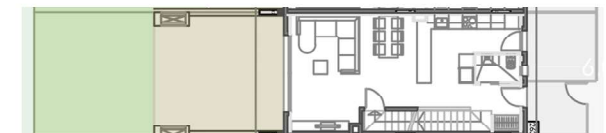
PLANTA BAIXA 0 0,5 1 1,5 2m